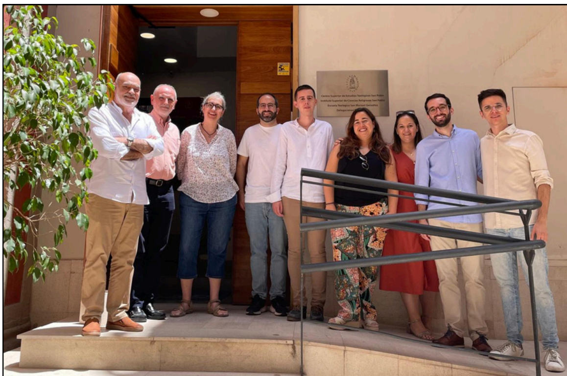
Algunos alumnos titulados, tras el examen, junto al director del Centro y varios miembros del tribunal

Con ellos alcanzan la cifra de 16 los que han obtenido este título en el centro desde su creación en 2018.